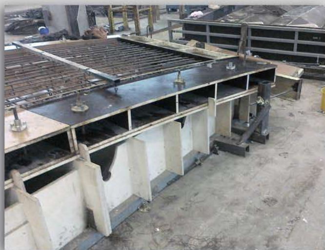
BETONÓZÁS ELŐREGYÁRTÓ TELEPEN