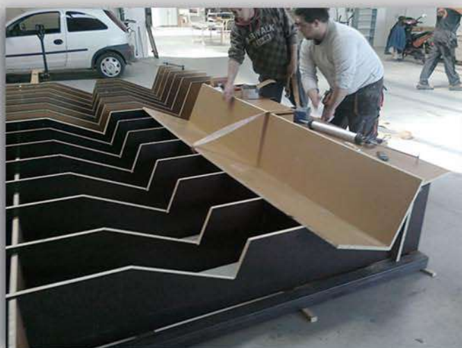
ZSALUK SZERELÉSE ACÉL KERETEN, GYÁRTÓÜZEMBEN