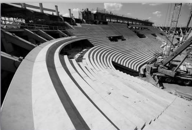
KÉSZTERMÉK HELYSZÍNEEN BESZERELVE