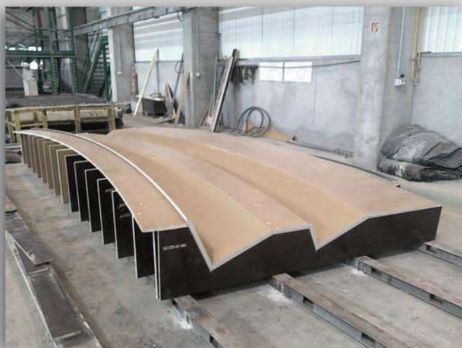
GYÁRTÓMŰVI VAGY HELYSZÍNI SABLONBEÁLLÍTÁS